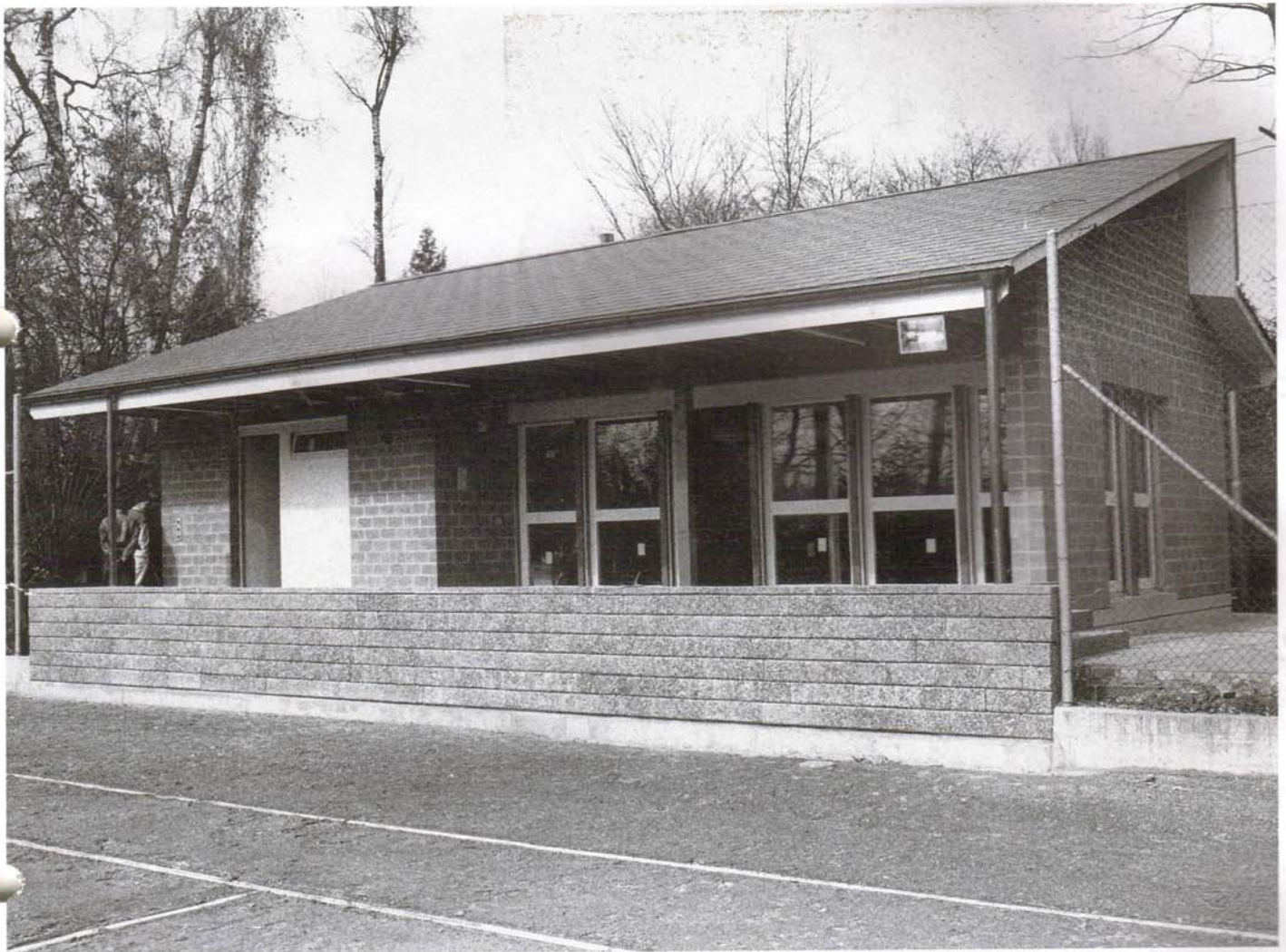
Das neue Klubhaus des TC Bellevue: Ein Stück Berner Tennisgeschichte