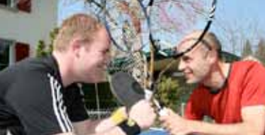
Eine neue Sportart löst einen Boom in der Rückschlagsportszene aus